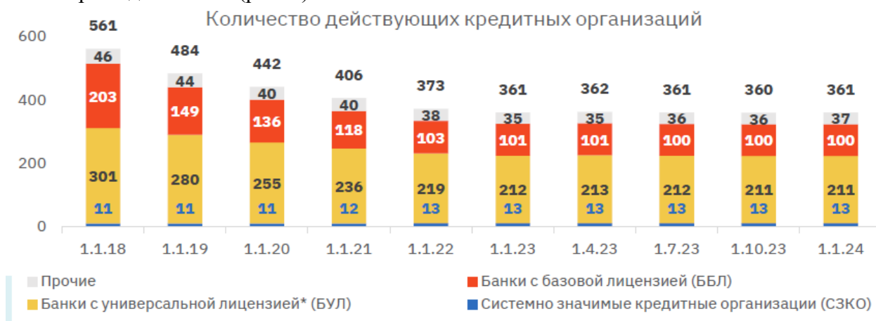
Рис. 1. Количество действующих кредитных организаций [2]

Рассмотрим институциональные изменения, произошедшие в банковской системе РФ за прошедшие 7 лет (рис. 1).