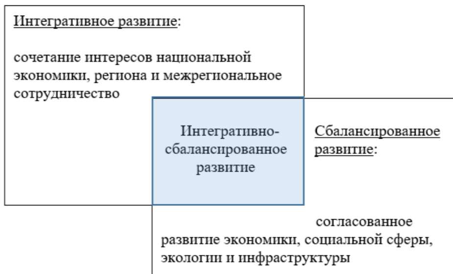
Рисунок 1 – Сущность интегративно-сбалансированного пространственного развития региона

Стратегический подход, направленный на долгосрочную и устойчивую трансформацию территории, объединяющий ресурсы, возможности, интересы взаимодействующих участников (государственных органов власти, бизнеса, гражданского общества) [4] и учитывающий региональные особенности, положен нами в основу интегративно-сбалансированной модели пространственного развития региона (Рисунок 1).