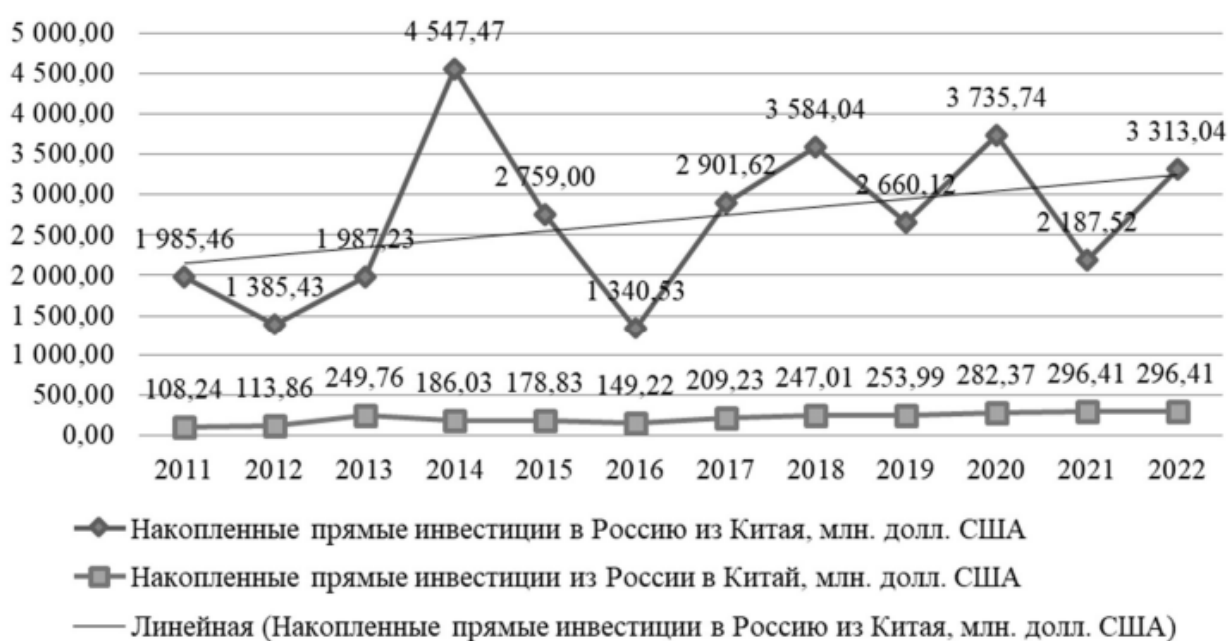
Рис. 2 - Динамика накопленных прямых инвестиций России и Китая по данным на начало периода в 2011-2022гг.

1) Энергетика. Традиционно, данная отрасль является одной из наиболее привлекательных сфер для китайских инвестиций в Россию. Сотрудничество в области добычи, переработки и транспортировки углеводородов, а также в развитии возобновляемых источников энергии остается приоритетным направлением для китайских компаний, которые активно принимают участие в проектах по разработке новых месторождений, строительству газопроводов и модернизации нефтеперерабатывающих заводов.