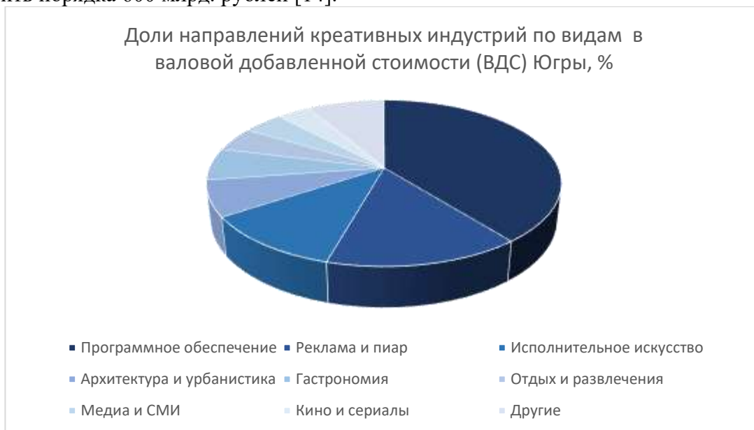
Рисунок 2 – Доли направлений креативных индустрий по видам в валовой добавленной стоимости региона (далее - ВДС), %.

В 2021 году вклад креативных индустрий в экономику региона составил 128 млрд. рублей или 2,3% от общего ВРП Югры. В 2022 году показатель достиг 137 млрд. рублей или 2,4%, в 2023 – 167 млрд. рублей (2,2%), в 2024 году – 175 млрд. рублей (0,43%). Прогнозируемый рост показателя демонстрирует устойчивую динамику развития: ожидается превышение отметки в 190 млрд. рублей в 2025 году, что свидетельствует о положительной тенденции в сфере креативных индустрий в автономном округе. По прогнозам губернатора Ханты-Мансийского автономного округа Руслана Кухарука, к 2030 году вклад креативных индустрий в валовой региональный продукт Югры должен составить порядка 600 млрд. рублей [14].