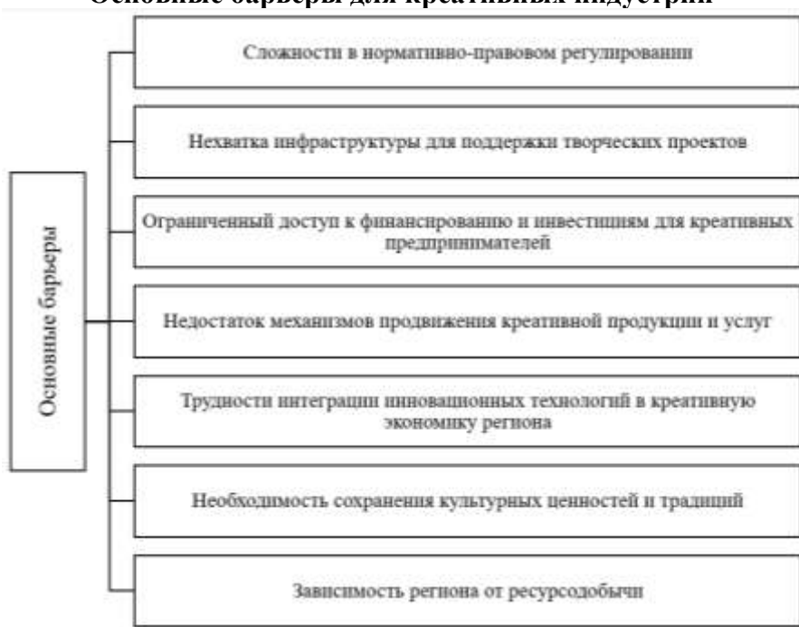
Рисунок 3 — Основные барьеры для креативных индустрий в ресурсном регионе Ханты-Мансийском автономном округе.

Югра предпринимает шаги по устранению этих барьеров через разработку законодательства, создание инфраструктуры поддержки, образовательных программ и механизмов финансирования, однако вызовы остаются актуальными для устойчивого развития креативной экономики.