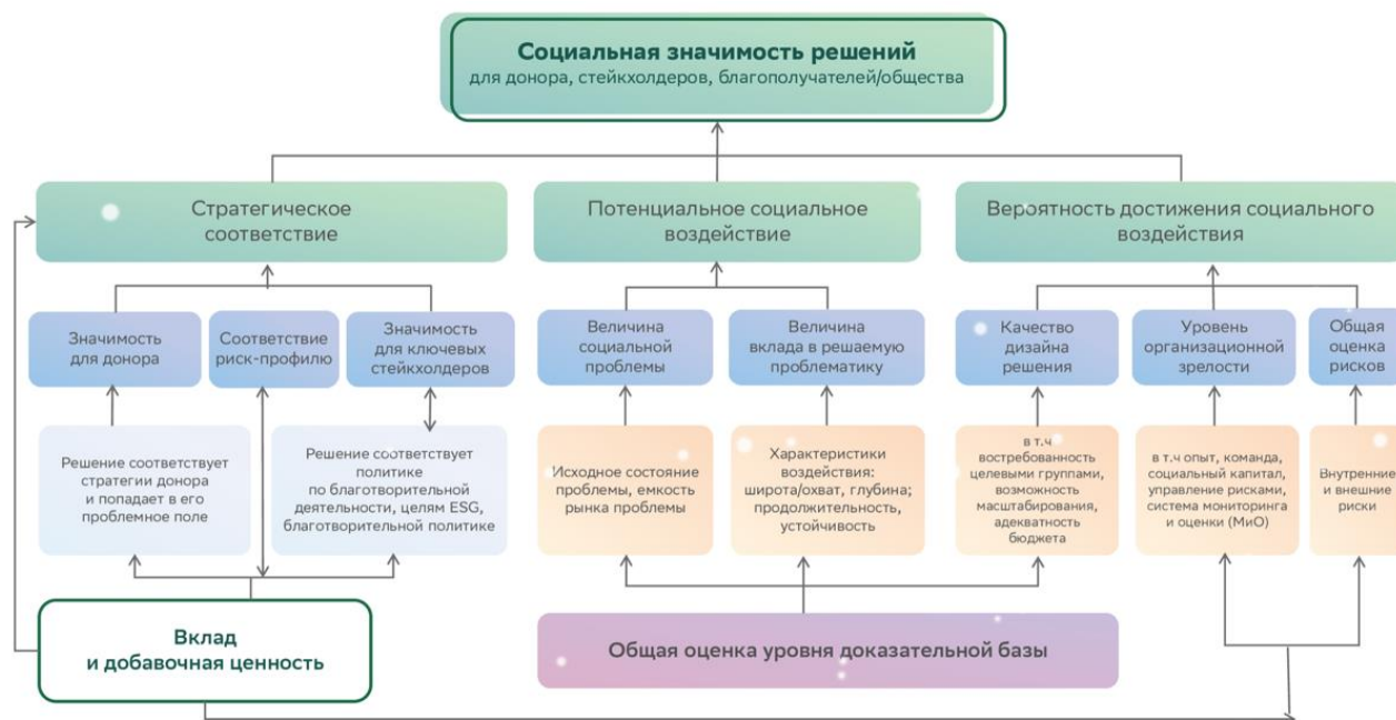
Рисунок 2 – Эффективность социальной интеграции ОЭПР в рамках методики МЭСИ

Представленный принцип анализа может применяться для: