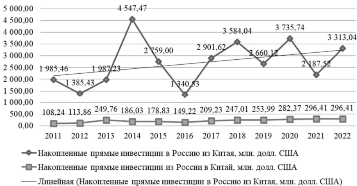
Рис. 2 - Динамика накопленных прямых инвестиций России и Китая по данным на начало периода в 2011-2022гг.

1) Энергетика. Традиционно, данная отрасль является одной из наиболее привлекательных сфер для китайских инвестиций в Россию. Сотрудничество в области добычи, переработки и транспортировки углеводородов, а также в развитии возобновляемых источников энергии остается приоритетным направлением для китайских компаний, которые активно принимают участие в проектах по разработке новых месторождений, строительству газопроводов и модернизации нефтеперерабатывающих заводов.