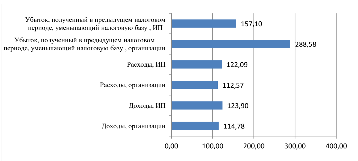
Рисунок 2. Динамика доходов и расходов налогоплательщиков, применяющих УСН (доходы-расходы) (темп роста, 2023/2021 гг, %) (составлено автором по [7])