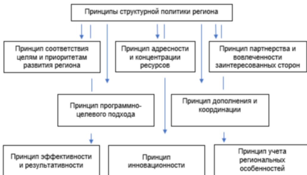
Рисунок 2 – Основные принципы региональной структурной политики

Принципы структурной политики региона – это основополагающие идеи, которые определяют подходы к разработке, реализации и оценке эффективности мер, направленных на преобразование экономической структуры региона для достижения устойчивого развития и повышения конкурентоспособности. Они служат ориентиром для принятия решений и обеспечивают согласованность действий всех участников процесса. Основные принципы региональной структурной политики представлены на рисунке (Рисунок 2).