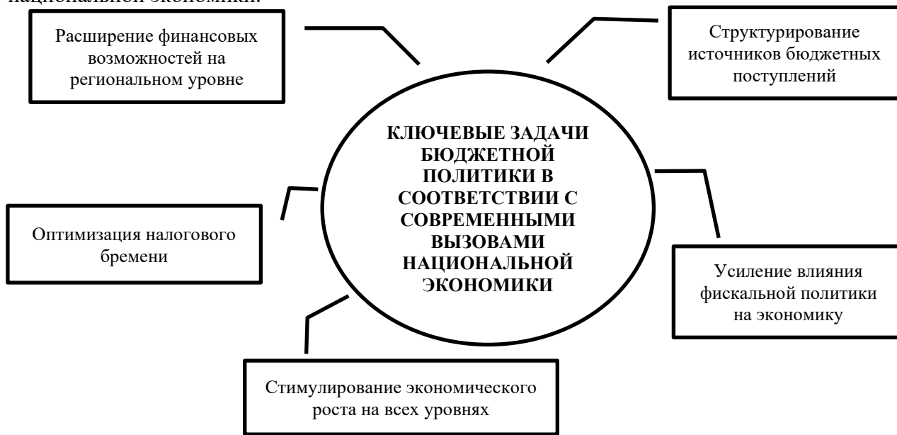
Рис. 1 Ключевые задачи бюджетной политики, отвечающие современным вызовам национальной экономики

Для эффективного макроэкономического регулирования, бюджетно – налоговая политика требует тщательного анализа и постоянного мониторинга бюджетных показателей, а также надежной системы управления фискальными рисками. На рис. 1 отражены ключевые задачи бюджетной политики, отвечающие современным вызовам национальной экономики.