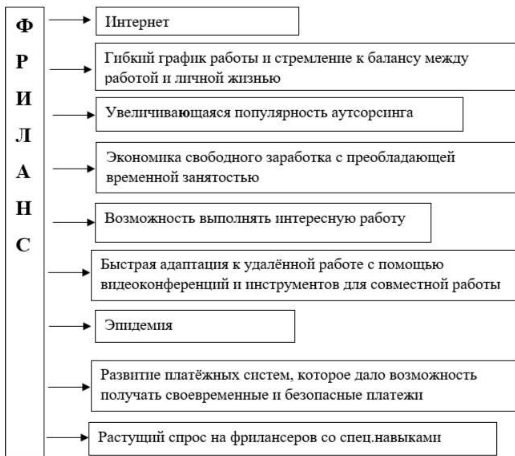
Рисунок 1. – Факторы, способствующие развитию фриланса

Хотя рост популярности фриланса привёл к изменениям в структуре занятости, его влияние на уровень безработицы более сложное и неоднозначное. С одной стороны, фриланс может дать возможность безработным или частично занятым людям получать доход. Он позволяет людям монетизировать свои навыки и таланты, что потенциально снижает общий уровень безработицы. С другой стороны, фриланс может привести к нестабильности на рынке труда, поскольку людям может быть сложно найти постоянную работу и они могут сталкиваться с нестабильностью доходов.