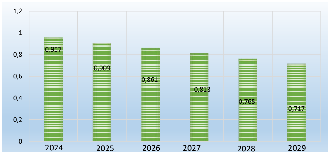
Рисунок 3- Динамика коэффициента долговой нагрузки с учетом используемого механизма на территории Воронежской области (рисунок составлен автором)

Таким образом коэффициент зависимости от долговой нагрузки может быть снижен на 24%, что указывает на положительные эффекты использования данного механизма. Использование экономических показателей 11 сельскохозяйственных потребительских кооперативов позволяет прогнозировать прирост выручки кооперативного сектора в размере 195,8 млн руб., несмотря на понесенные потери от предоставленной скидки кооперативам за счет повышения эффективности производственных процессов. Прирост паевого фонда создает мощный фундамент для развития материальной базы кооперативного движения, способствующий снижению долговой нагрузки и уходу от финансовой зависимости со стороны. Каждый участник данного механизма получит увеличение выручки более 20 млн руб. за период исполнения возникших обязательств.