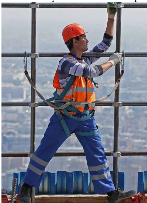
Рис. 2. Тестовый кадр.

Результат. Таким образом, система может использоваться как инструмент оперативной поддержки инженера по охране труда, формируя объяснимые подсказки и сокращая время ручного поиска нормативов. Тестовое изображение(Рис. 2)